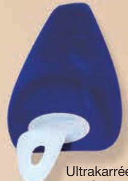
Ultrakarrée mit Griff 6-550300