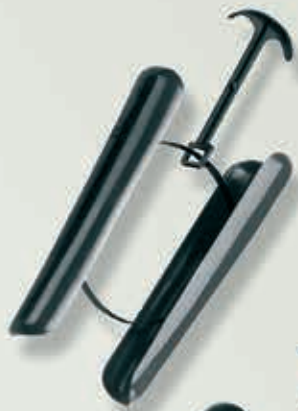
Former für Stiefeletten 9-410184