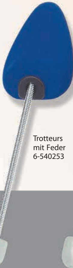
Trotteurs mit Feder 6-540253