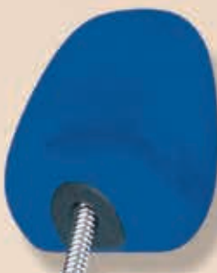
Karrée mit Feder 6-550152