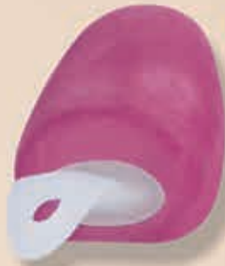
Superrund mit Griff 6-550200