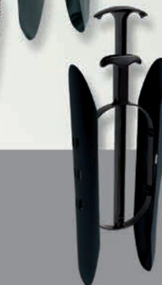
Jet mit Aufhänger und Sensomatic-Mechanik®, in Tragetasche, VE 12 Paar Gr. I bis 28 cm Schaft, 6-560001 Länge 24 cm Gr. II bis 36 cm Schaft, 6-560002 Länge 32 cm Gr. III ab 37 cm Schaft, 6-560003 Länge 37 cm