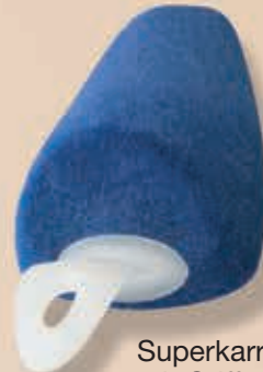
Superkarrée mit Griff 6-550000