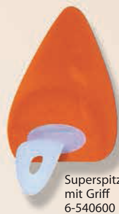
Superspitz mit Griff 6-540600