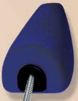
Ultrakarrée mit Feder 6-550352