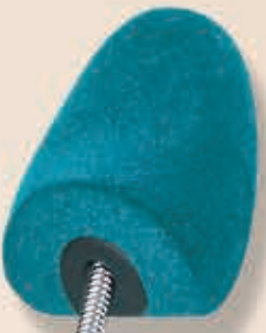
Rund mit Feder 6-540852