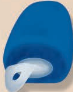
Karrée mit Griff 6-550100