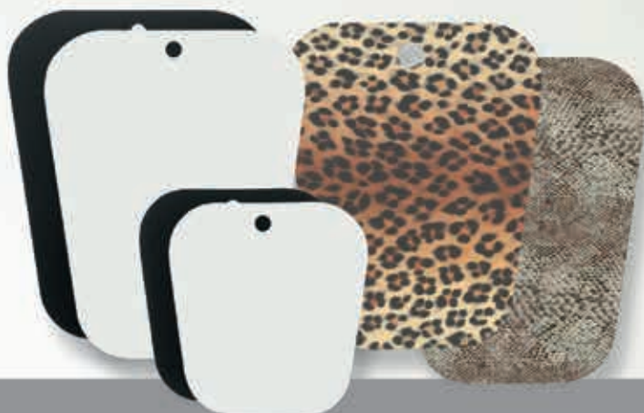
Boot show Deco Schaftformer-Folie Boot show 26 cm, Schwarz 9-450020 Boot show 26 cm, Natur 9-450030 Boot show 34 cm, Schwarz 9-450021 Boot show 34 cm, Natur 9-450031 Boot show 35 cm, Schlange 9-450001 Boot show 35 cm, Leopard 9-450002