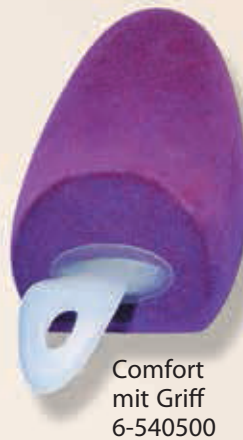
Comfort mit Griff 6-540500