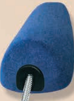
Superkarrée mit Feder 6-550052