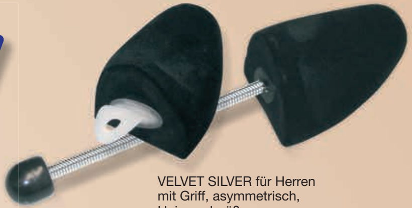
VELVET SILVER für Herren mit Griff, asymmetrisch, Universalgröße 9-540900