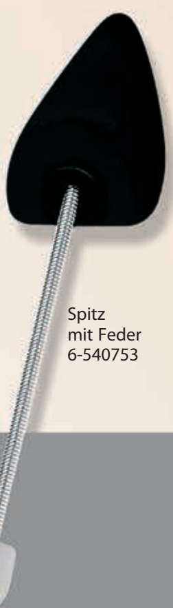
Spitz mit Feder 6-540753