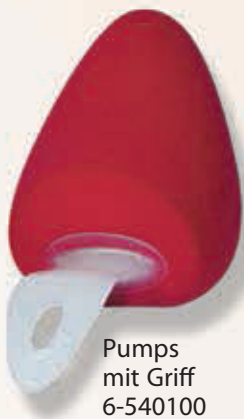
Pumps mit Griff 6-540100