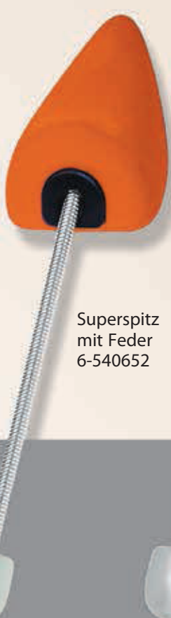
Superspitz mit Feder 6-540652