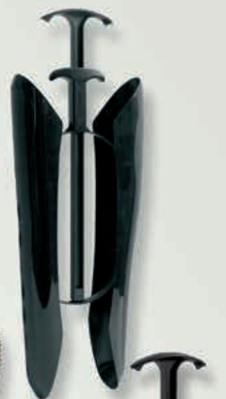
Airquick Weitschaft mit Aufhänger und Sensomatic-Mechanik®, Schalen transluzent gefrostet in Tragetasche, VE 12 Paar Gr. IV Länge 32 cm 6-570005 Gr. V Länge 37 cm 6-570006