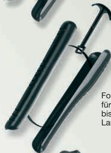
Former für Stiefelschaft bis 28 cm 9-410284 Langschaft 9-410484