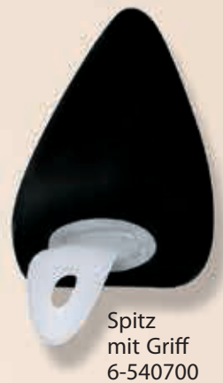
Spitz mit Griff 6-540700