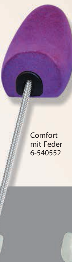
Comfort mit Feder 6-540552