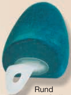
Rund mit Griff 6-540800