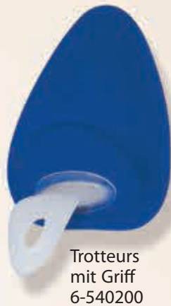
Trotteurs mit Griff 6-540200