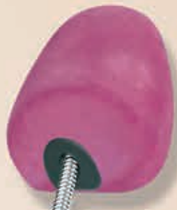
Superrund mit Feder 6-550252