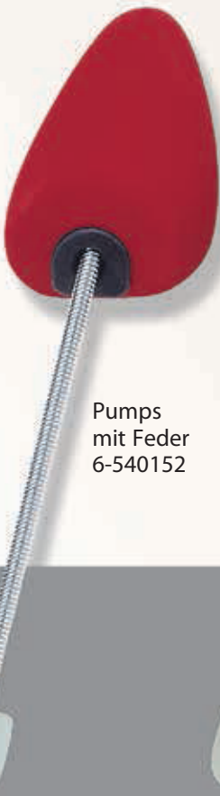
Pumps mit Feder 6-540152