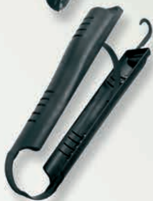
Vario Stiefelspanner 29 cm 9-430000