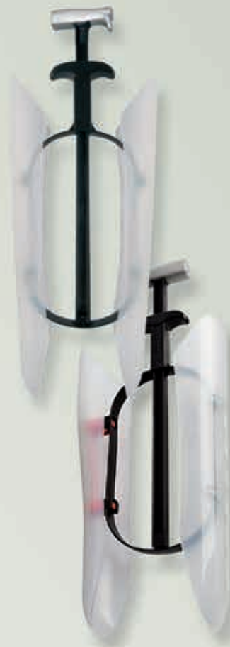
Airquick mit Aufhänger und Sensomatic-Mechanik®, Schalen transluzent gefrostet in Tragetasche, VE 12 Paar Gr. I bis 28 cm Schaft, 6-570001 Länge 24 cm Gr. II bis 36 cm Schaft, 6-570002 Länge 32 cm Gr. III ab 37 cm Schaft, 6-570003 Länge 37 cm